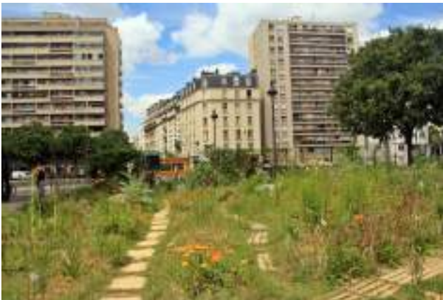
Grădină comunitară din Paris