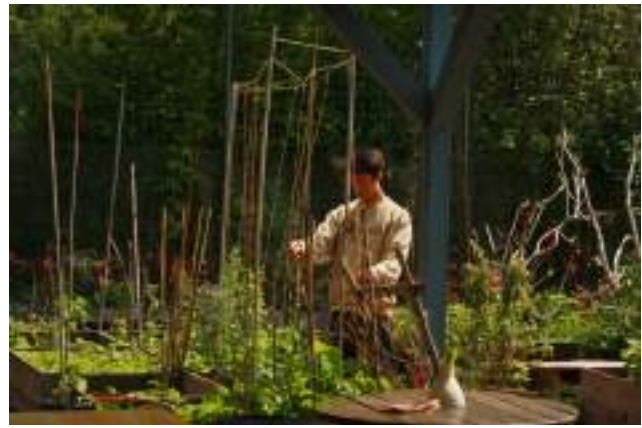
Grădină comunitară din Berlin

Orașul Chișinău nu dispune de vreun mecanism prin care locuitorii care vor să practice grădinăritul (ca practică individuală sau colectivă) să poată avea acces la pământ, iar agricultura urbană nu figurează în strategiile de dezvoltare a orașului. Spre exemplu, Strategia „Chișinău – oraș verde” a Primăriei menționează că una dintre provocările în domeniul utilizării terenurilor este că „unele terenuri agricole sunt folosite acum drept terenuri de construcție” 8 , însă documentul nu prevede soluții pentru conservarea și dezvoltarea funcției agricole în oraș.