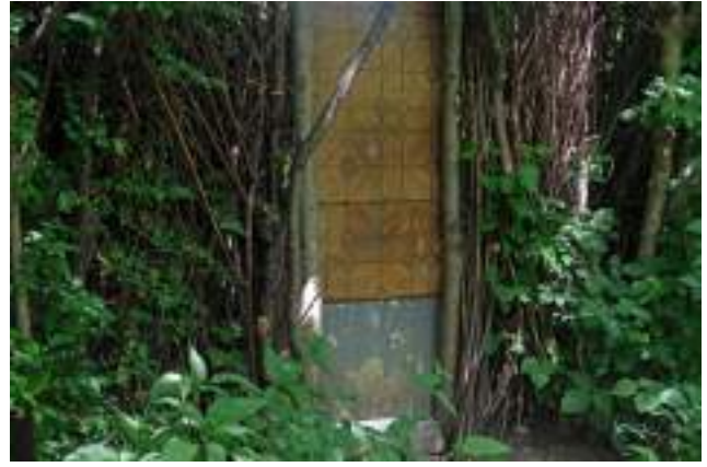
Poartă și gard improvizat a unei grădini din parcul La Izvor.