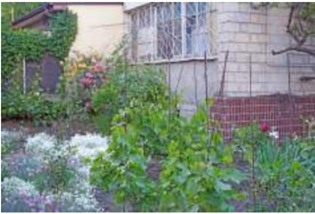
Flori și viță de vie într-o grădină individuală din curtea blocului (str. Calea Orheiului, Poșta Veche).