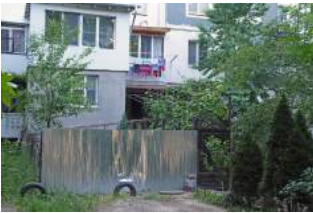
Viță de vie într-o grădină individuală din curtea blocului (Poșta Veche).