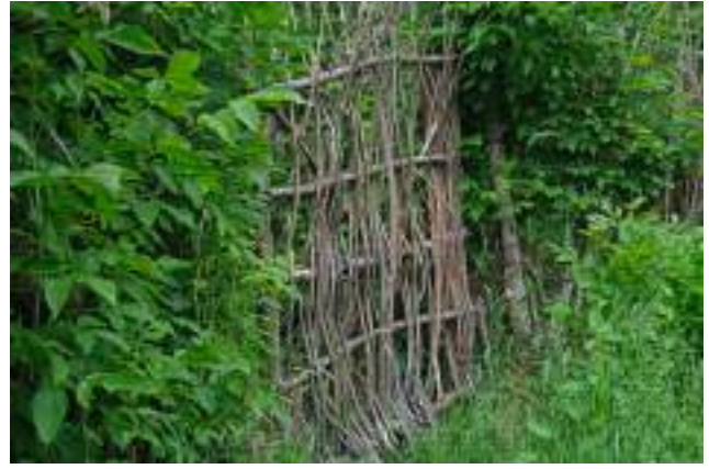
Poartă și gard din nuiiele pentru a delimita o grădină din parcul La Izvor.