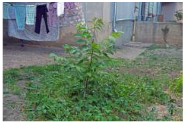
Căpșuni care cresc în jurul unui nuc într-o grădină individuală în curtea blocului (str. Doina, Poșta Veche).