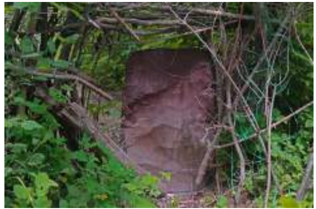
Poartă și gard improvizat a unei grădini din parcul La Izvor.