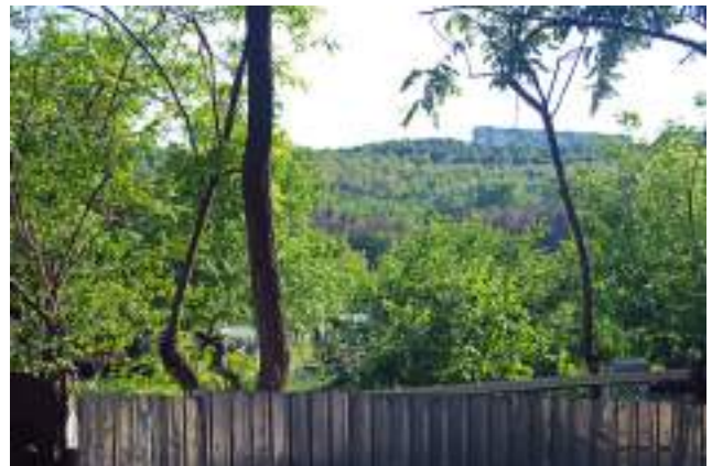
Grădină urbană informală în Rezervația "Talpa Giștei" (Poșta Veche)