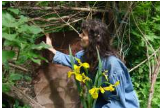
Poartă și gard improvizat a unei grădini din parcul La Izvor.