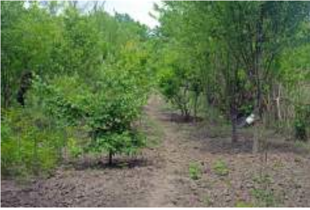
Interiorul unei grădini din Parcul La Izvor.