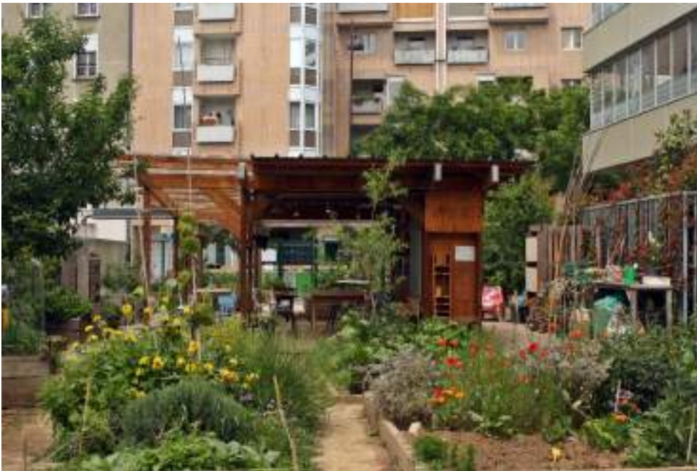
Grădină comunitară din Paris