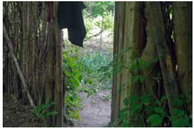
Interiorul unei grădini din Parcul La Izvor.