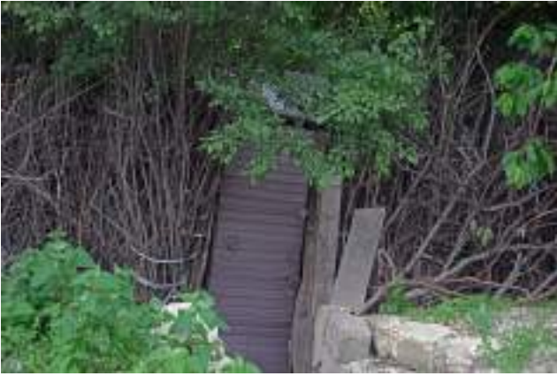
Intrare într-o grădină informală din spatele cooperativei de garaje (Ciocana).