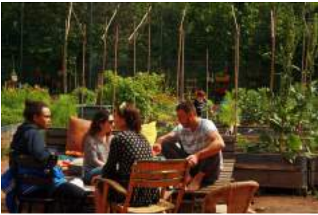
Grădină comunitară din Berlin