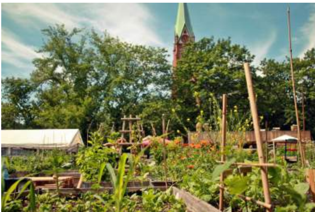
Grădină comunitară din Berlin

În tot mai multe orașe există o recunoaștere instituțională clară a grădinăritului urban atât de legislația națională, cât și locală, fapt care a influențat considerabil dezvoltarea grădinăritului urban în ultimii ani.