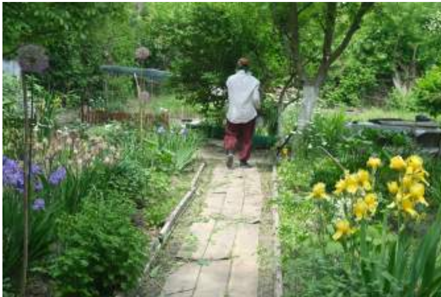
Interiorul unei grădini din Parcul La Izvor.