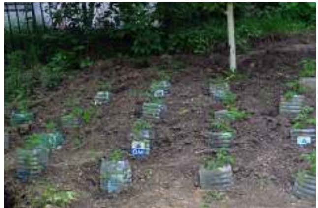
Roșii care cresc într-o grădină individuală în spatele blocului (Poșta Veche).