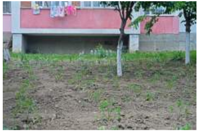
Roșii care cresc într-o grădină individuală în spatele blocului (Poșta Veche, str. Iazului).