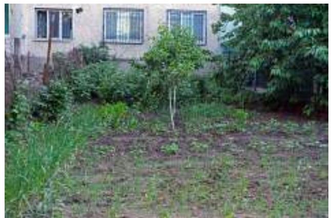
Ceapă, usturoi, fasole, zmeură și fructiferi care cresc într-o grădină individuală în curtea blocului (Poșta Veche).