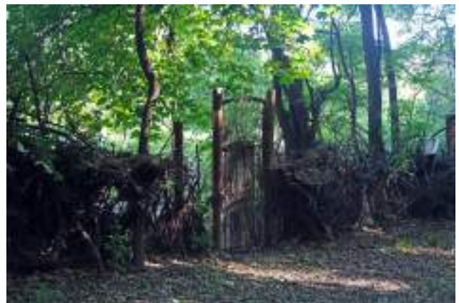
Poartă și gard improvizat a unei grădini informale din Rezervația "Talpa Giștei" (Poșta Veche)