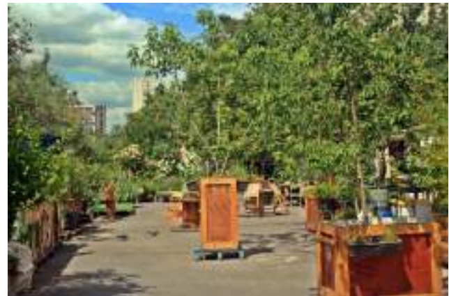
Grădină comunitară din Paris

Un lucru interesant de observat este că grădinile înființate de asociațiile de locatari din Barcelona sunt considerate grădini informale , pe când la Paris instituționalizarea grădinilor comunitare se realizează prin asociațiile de locatari.