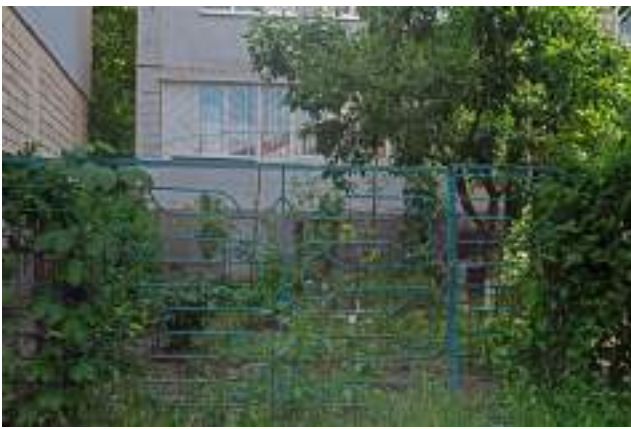
Grădină individuală în spatele blocului (Poșta Veche, str. Calea Orheiului).