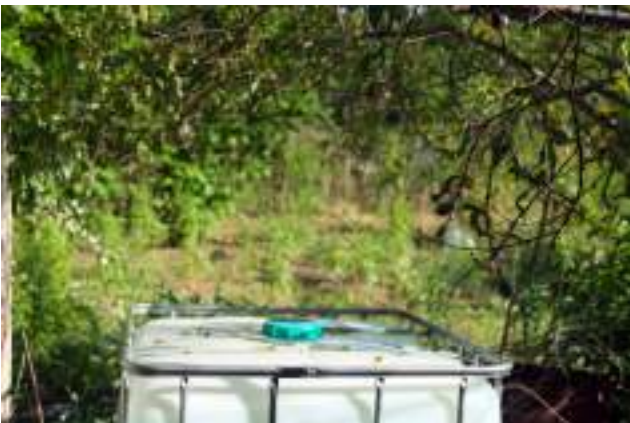
Rezervor de apă pentru irigare într-o grădină urbană informală în Rezervația "Talpa Giștei" (Poșta Veche)