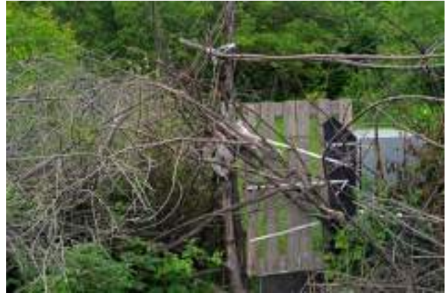
Intrare într-o grădină informală din spatele cooperativei de garaje (Ciocana).