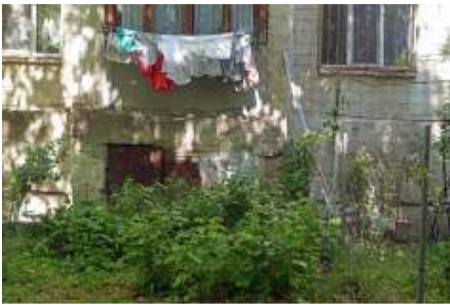
Zmeură într-o grădină individuală în spatele blocului (Poșta Veche)