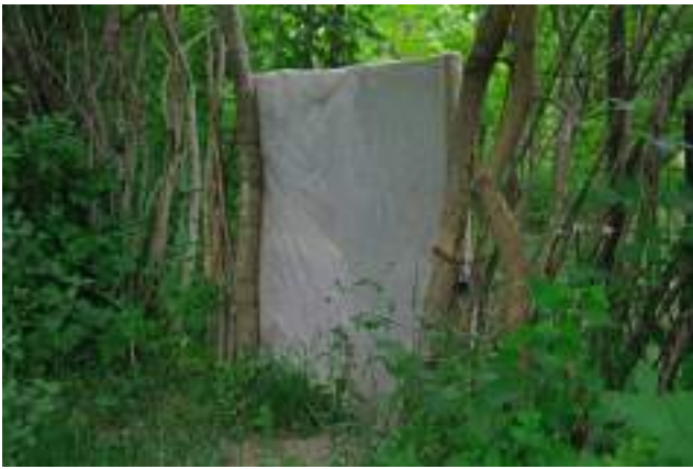
Poartă și gard improvizat a unei grădini din parcul La Izvor.