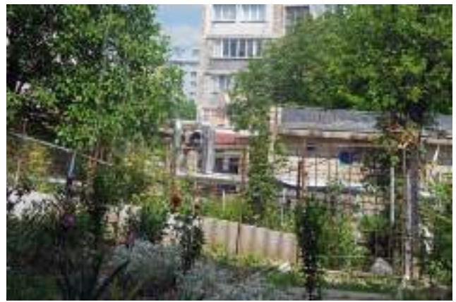
Grădină individuală în spatele blocului (Poșta Veche, str. Iazului).