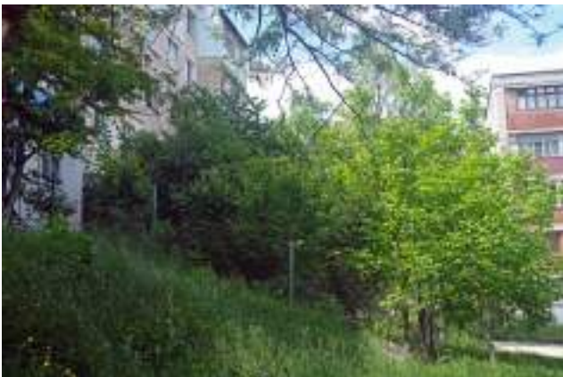
Roșii care cresc într-o grădină individuală în spatele blocului (Poșta Veche).