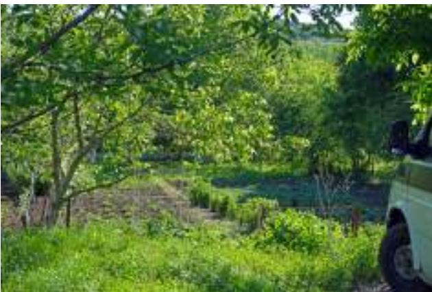
Grădină urbană informală în Rezervația "Talpa Giștei" (Poșta Veche)