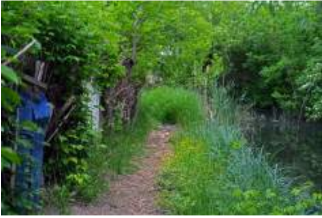
Grădini informale amplasate de-a lungul râului Bâc, în parcul La Izvor.