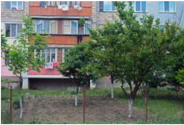
Roșii care cresc într-o grădină individuală în spatele blocului (Poșta Veche, str. Iazului).