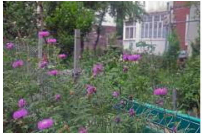
Grădină individuală în spatele blocului din sectorul Ciocana, cu pomi fructiferi și flori.