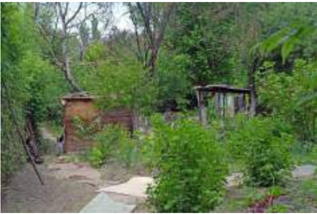
Interiorul unei grădini din Parcul La Izvor.