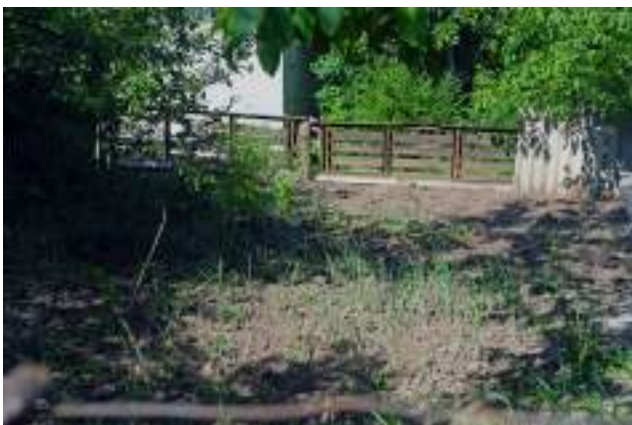
Ceapă care crește într-o grădină individuală în curtea blocului (str. Doina, Poșta Veche).