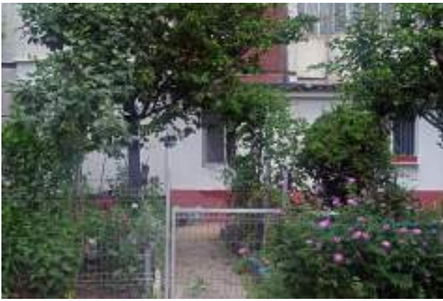
Grădină individuală în spatele blocului din sectorul Ciocana, cu pomi fructiferi și flori.